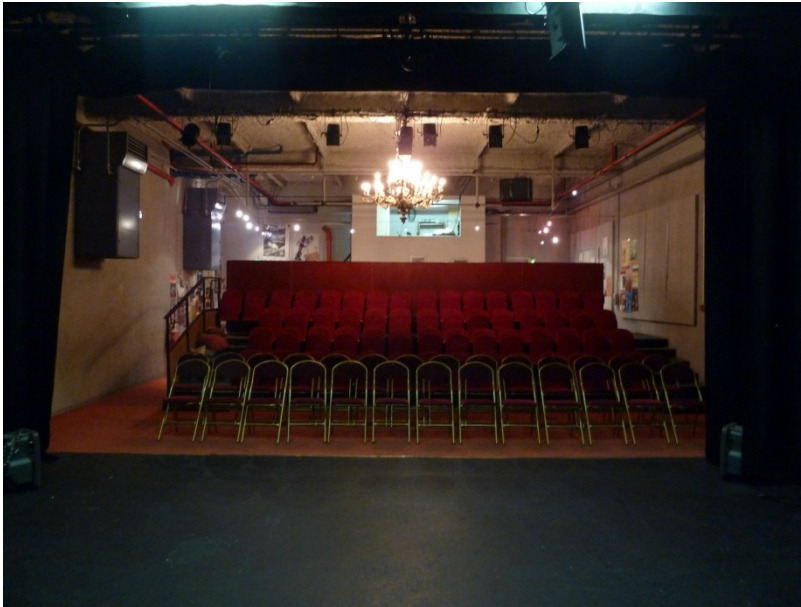
Vue depuis le fond de la scène