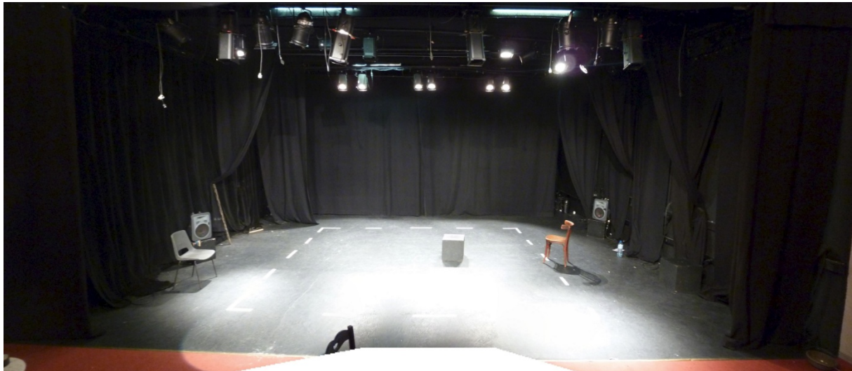
Vue depuis le gradin