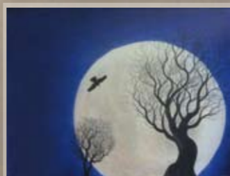
La paix et la nuit Lionel D. (1989)