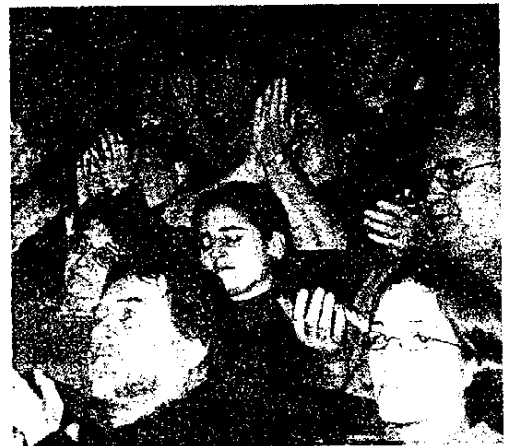
Des applaudissements pas comme les autres